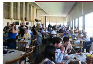
Encontro reuniu muitas pessoas