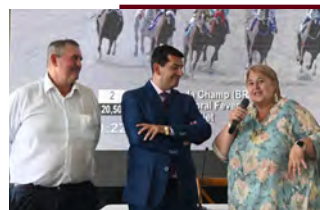
Ministra da Defesa, Sandra Lazo, no evento